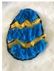
voorbeeld met draadjes